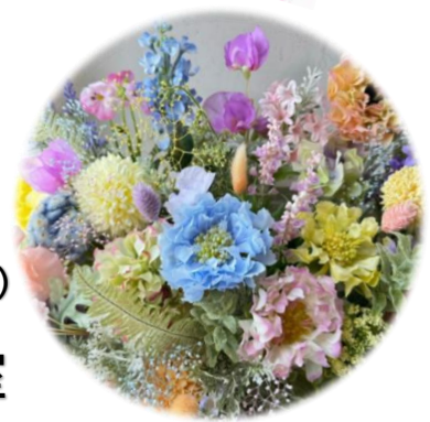
初夏のトレジャーボックスアレンジ(展示)