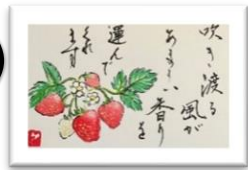
書道教室「憬水書院」主宰 憬水・葉書絵展示